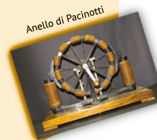
Anello di Pacinotti