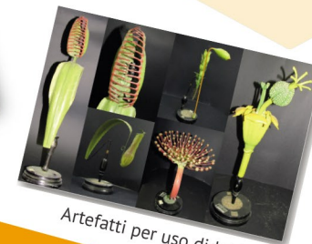
Artefatti per uso didattico